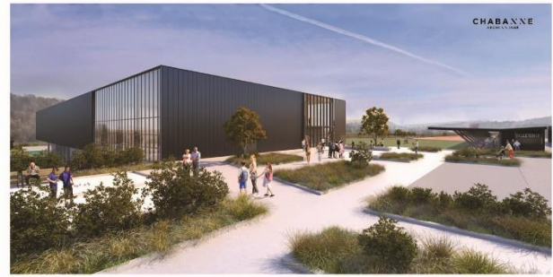
VUE DU COMPLEXE DEPUIS LE PARVIS