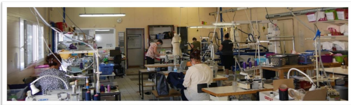
Photos de la Recyclerie du Pays Bellegardien et de Vêt'cœur (2 du bas)