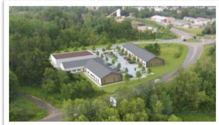
Représentations graphiques du futur pôle de santé pluridisciplinaire du Pays Bellegardien