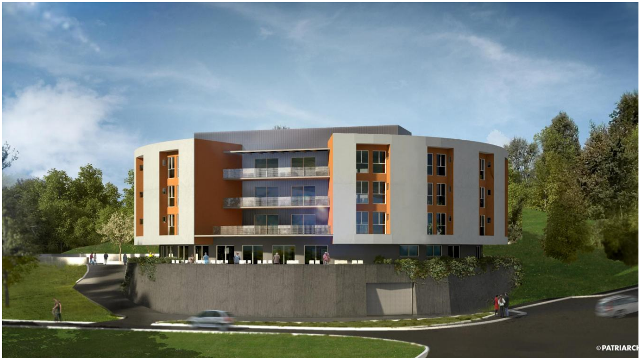
Visuel de l'EHPAD en construction